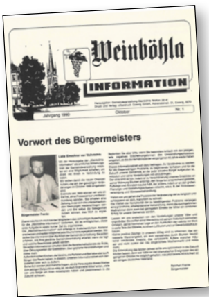
1. Ausgabe der Weinböhla-Information im Oktober 1990

Ein frisches und zeitgemäßes Layout, das sich in das Corporate Design der Gemeinde Weinböhla einfügt, lässt das Amtsblatt in neuem Glanz erstrahlen. Wir bedanken uns bei der Druckerei B. KRAUSE GmbH aus Radebeul für das neue Design!