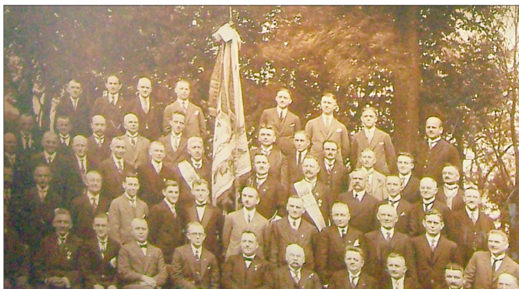
Männerchor um 1909