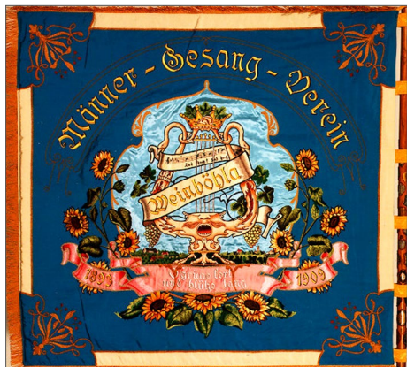
Traditionsfahne der Chorgemeinschaft

im Traditionslokal „Oberer Gasthof“ feierlich geweiht. Das Original-Fahnentuch von 1909 ist im Weinböhlauer Rathaus ausgestellt.