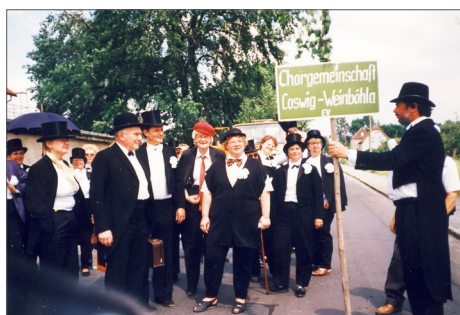
Sängertreffen in Weinböhlen im Jahr 2000