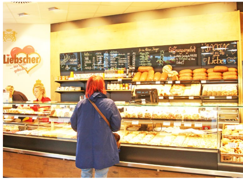
In der neuen Filialen der Bäckerei Liebscher und der Fleischerei Richter können die Back- und Wurstwaren auch vor Ort verzehrt werden, die neuen Sitzgelegenheiten laden dazu ein.