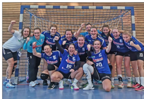
1. Frauenmannschaft

Nachdem tollen 30:25-Heimsieg gegen den SC Hoyerswerda war die Freude bei unseren