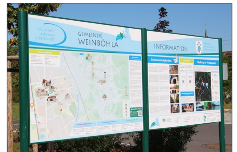
Touristische Tafeln an der Endhaltestelle der Straßenbahn und am Zschendorfer Weg (Bahn-Haltestelle)

Seit Mitte September werden Touristen am P+R Parkplatz am Zschendorfer Weg und an der Endhaltestelle der Straßenbahnlinie 4 durch vier neue touristische Hinweisschilder begrüßt. Die Schilder mit der neuen Gestaltung wurden an den beiden Standorten montiert. Sie sind attraktiv gestaltet, das Corporate Design von Weinböhla in den Blautönen wurde aufgegriffen. Sie geben in Wort und Bild Auskunft über die Geschichte des Ortes, Sehenswürdigkeiten wie das Heimatmuseum oder die Türme. Die neue Beschilderung führt Besucher, die in Weinböhla zu Fuß oder mit dem Fahrrad unterwegs sind, zu interessanten Zielen. Das VELOCIMUM wird ebenso auf den touristischen Tafeln beworben. Per QR-Code können geführte Radtouren durch Weinböhla unternommen werden und weitere spannende Details über Weinböhla und seine Sehenswürdigkeiten nachlesen. Eine schöne Aktion, die bestimmt auch so manchen Weinböhler noch mehr über seinen Heimatort verrät. Die neue Beschilderung ist gewiss auch ein Zugewinn für die Gäste des Ortes und für die Vermarktung der touristischen, gastronomischen und Handelseinrichtungen.